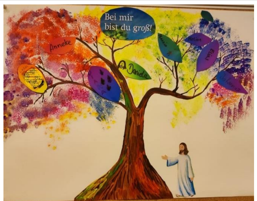
Eindrücke aus der ersten Gruppenstunde