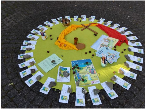
Alle Familien sind willkommen beim Familiennachmittag.