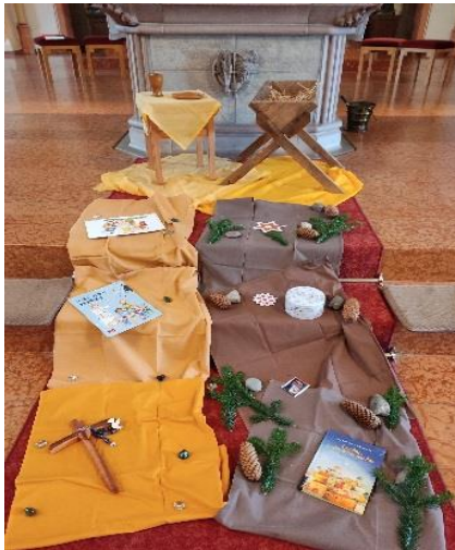
Im Advent machen sich die Kinder auf den Weg zum Weihnachtsfest und zur Erstkommunion.