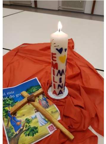
Eindrücke aus der ersten Gruppenstunde